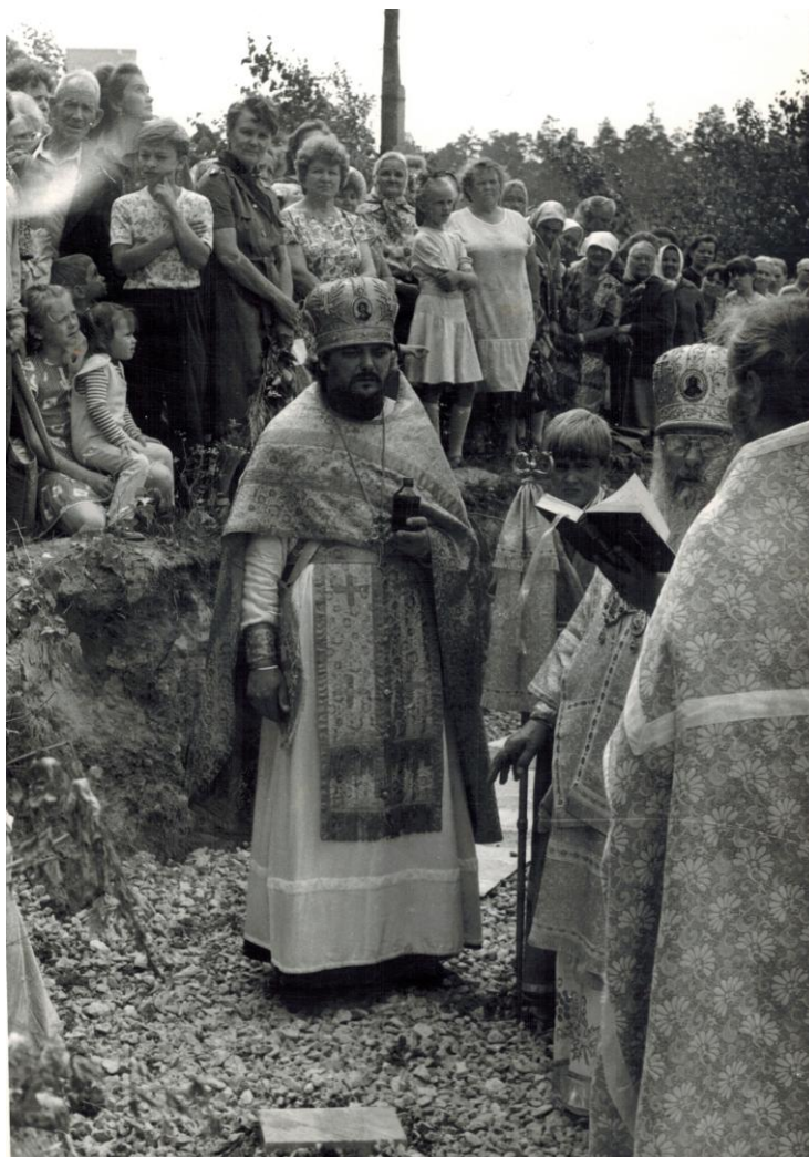
Освящение закладного камня Князе-Владимирского храма архиепископом Мелхиседеком, 1991 г

Каменная однопрестольная церковь была заложена в 1991 г. Освящена во имя равноапостольного князя Владимира в сентябре 1994 г. и является действующей.[20] Таким образом, снесенный молитвенный дом дал имя двум асбестовским храмам.