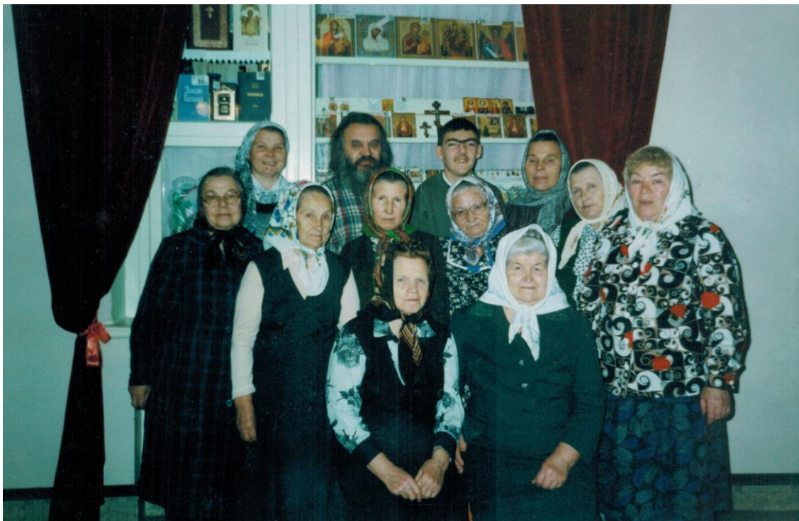
Церковники храма Трех Святителей, 200? г.