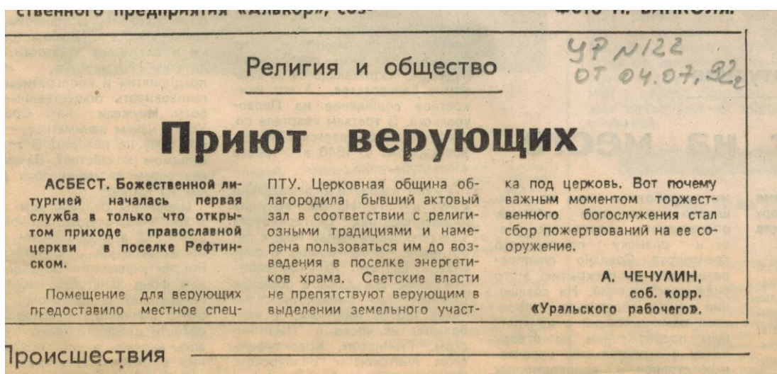
Газ. «Уральский рабочий» от 04.07.1992 г

Нужно заметить, что рефтинский храм - это второй домовый (то есть, не отдельностоящий) храм в Екатеринбургской епархии в новое время.. Сейчас, конечно, таких уже много. А первый – это домовый храм в архиерейском доме. Вообще, приходов тогда в Свердловской области было 70-80, сейчас - несколько сотен.