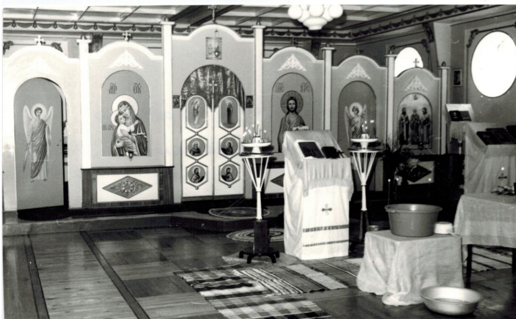
Вид храма по состоянию на 1992 г

21 мая в СПТУ состоялось собрание православных верующих. Затем отец Павел в помещении храма отслужил водосвятный молебен. Это было первое богослужение в стенах церкви. Строго говоря, это молебенное помещение нужно называть молитвенным домом (в документах епархии последнего времени оно так и называется). Но даже в словаре Даля: « У нас церковь отличается от молитвенного дома освящением престола, заменяемого в походной переносной церкви антимином». Т.е., да, молитвенный дом – но все равно церковь.