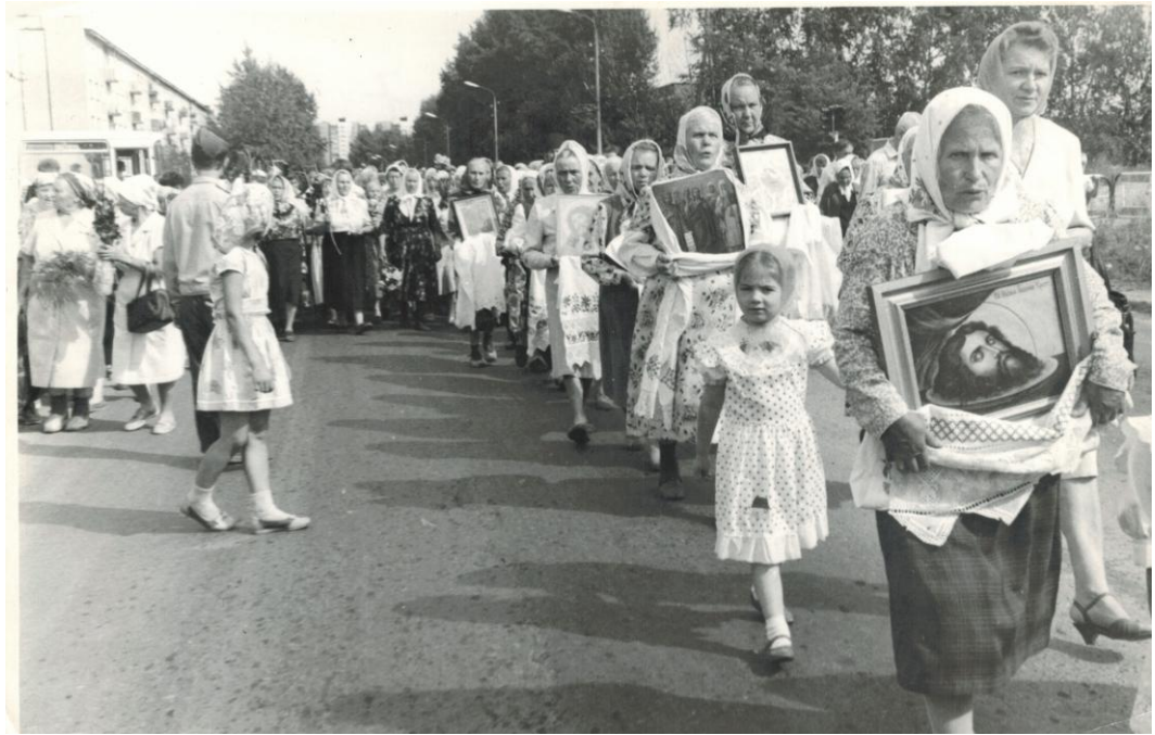
Крестный ход от церкви на Луговой к месту закладки нового храма, 1991 г.