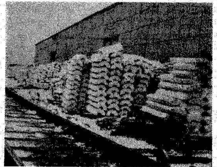
НА СНИМКАХ: хозяйство отдела технического снабжения стройки, в таком состоянии здесь хранятся стальные изделия, сколько изоляционных изделий придет в негодность на участке УЭМ при таком способе хранения.