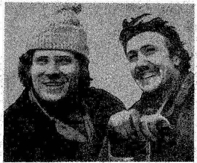
XVIII съезду ВЛКСМ — достойную встречу

Строители и монтажники Рефтинской ГРЭС заложили хороший старт. Достигнутые успехи в первом квартале дадут основание для производственной работы всех коллективов во втором и последующих кварталах 1978 года.