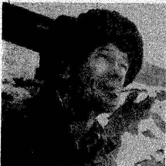
● ПРАВОФЛАНГОВЫЕ ПЯТИЛЕТКИ

— ЖКО совместно с сотрудниками лесничества учли в поселке весь сухой и подвергнутые всевозможным воздействиям деревья. Силами ЖКО в апреле будут убраны все деревья, представляющие опасность для людей.