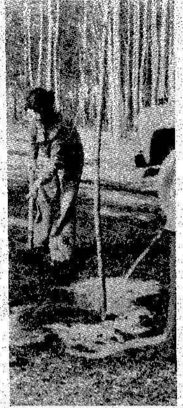
Идет посадка деревьев.