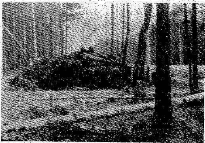
ФОТООБВИНЕНИЕ Вот такие кучи земли, пней, поломанных деревьев можно видеть по всей дороге № 2 на птицефабрику. Строймеханизаторы, делая дорогу, поленились убрать мусор, загрязнили лес. А ведь тов. Нифонтова предупреждали об этом уже не раз.