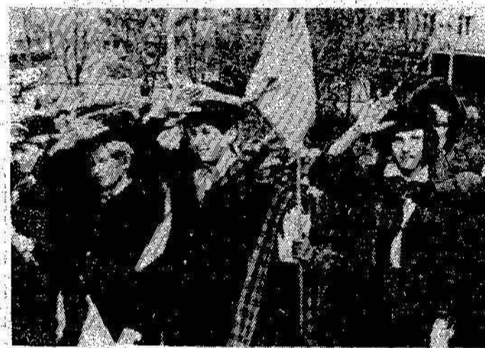
Бодрым маршем, в красочных колоннах, под звуки горнов и барабанов идут по поселку пионеры. 19 мая, в День рождения пионерии, у трибуны состоялась торжественная линейка двух дружин. Четко звучат рапорта. Юные ленинцы докладывают, что проделано дружинами по пионерскому маршу «Пионеры всей страны делу Ленина верны». Ребята поздравили с праздником руководители партийных, профсоюзных комитетов стройки и станции, старшие друзья — комсомольцы. А потом состоялся большой концерт, подготовленный учащимися двух школ.