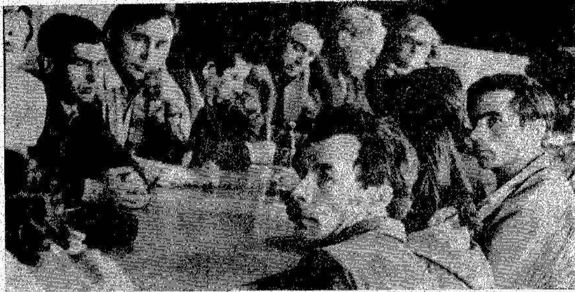
Идет заседание редакции газеты «Асбестовский рабочий» и многотиражной газеты «Энергостроитель».

Рабочие корреспонденты приняли обращение ко всем рабкорам Асбеста.