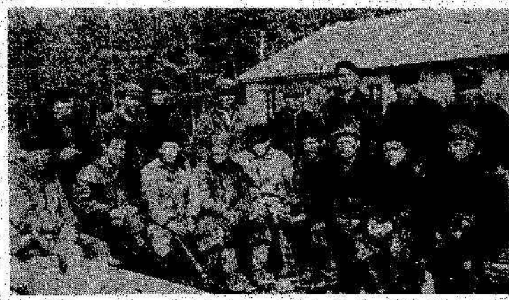
НА СНИМКАХ: вручную приходилось укладывать железнодорожные пути; первый бетонный завод; строители временного поселка на Олушке.