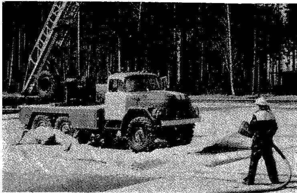
Демонстрация техники пожаротушения