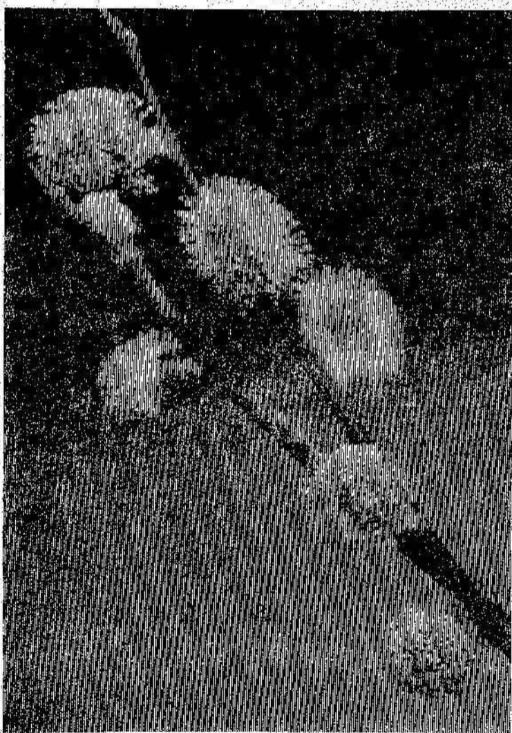
Весенний фотозгод Саша Камаева.

вентиляционщики, электромонтеры, птичники, ночные птичники, няни в детские сады, кухонные работники. Обращаться в отдел кадров птицефабрики.