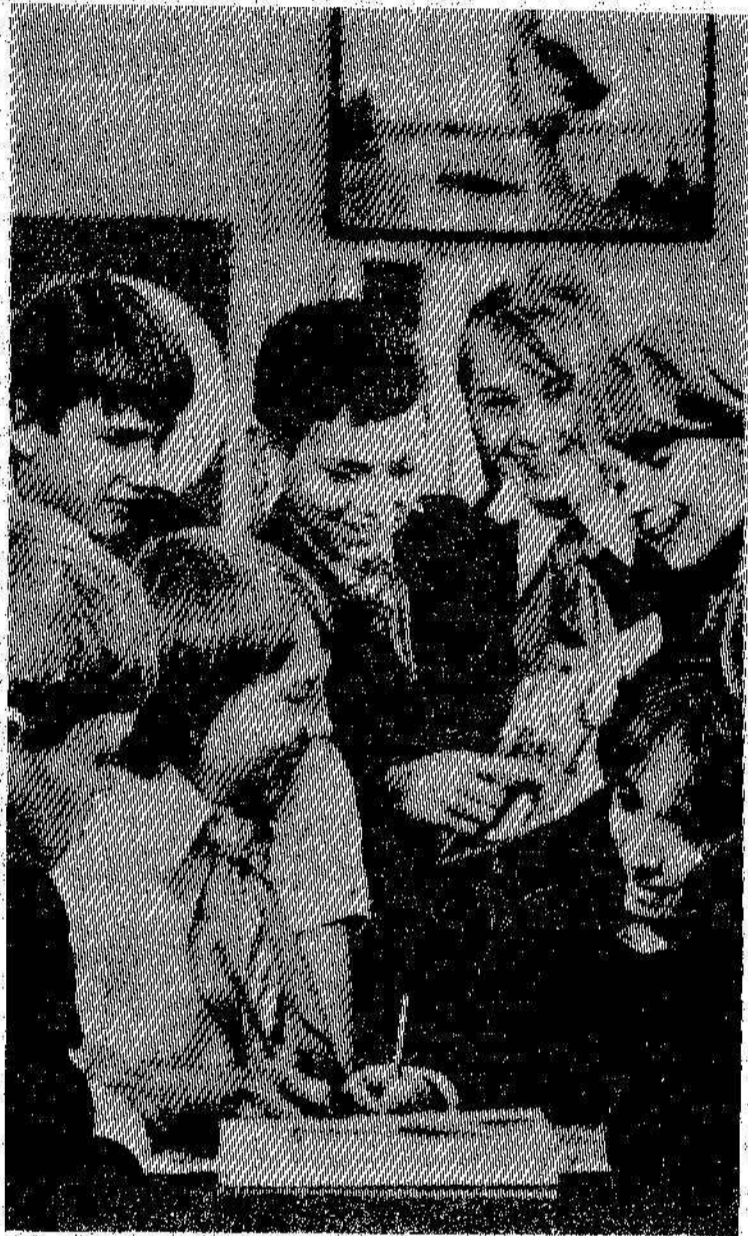
19 мая краснаягустая пионерия страны отметила день своего рождения. Настоящий праздник был и у рефтинских школьников. В этот день пополнилась пионерская дружина имени Вити Черевичкина; на торжественной линейке третьеклассникам повязали алые галстуки. Затем ребята стали участниками спортивного праздника «Веселые старты». А в пионерской дружине имени Н. Кузнецова школы № 17 проводилась спартакиада, соревнование велосипедистов «Волшебное колесо».