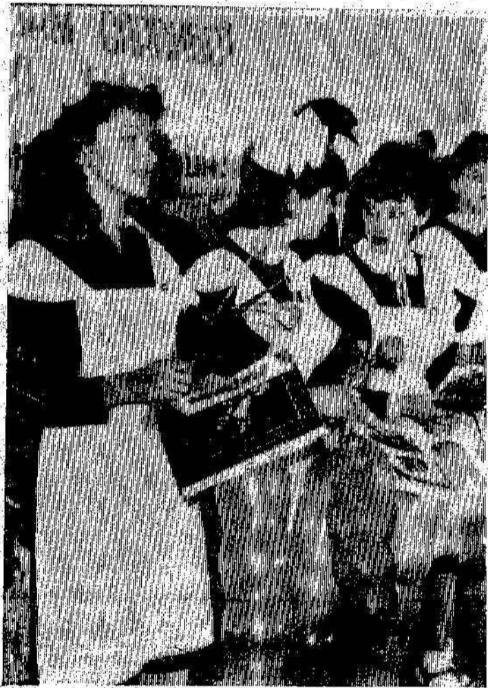
НА СНИМКЕ: выпускники школы № 17 во время торжественных минут: совсем скоро для них прозвучит последний раз школьный заветный звонок.

Школьный дом — заветный берег детства — ты уже не видишь впереди, но тебя лишь только вместе с сердцем можно вынуть из моей груди. Знаем, что в пути нам будет туго, но всегда нас школа будет ждать. Будет ждать, как дорогого друга, как уметь ждать нас только мать. И успехи наши, и проказы будут педагоги вспоминать, приводить в пример нас будут даже — все умеют нам они прощать. Школа — дом наш, добрый и веселый и любимый нами навсегда, пусть дороги разойдутся после школы, дружбы школьной не забудем никогда, и, передавая эстафету Юным первоклашкам, хочется сказать: Берегите и любите школу эту, чтобы и она вас помнила, как мать. Н. ШИМИНЦЕВА.