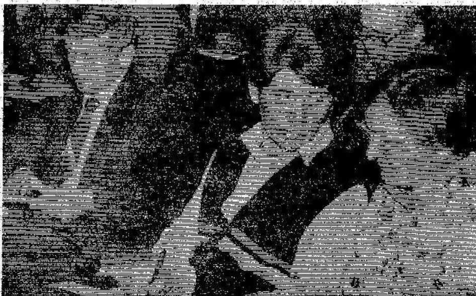
НА СНИМКЕ: идет обсуждение анкеты.

Пропагандистам был выдан «Перечень узких мест», подготовленный ПТО, на основе которого в ряде школ сформулированы конкретные практические задачи. В настоящее время в каждом цехе имеется более глубоко и детально разработанный свой «Тематический план для рационализаторов и изобретателей на XII пятилетку».