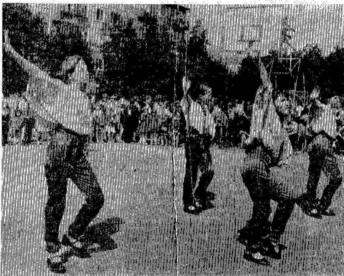
Во время праздника.