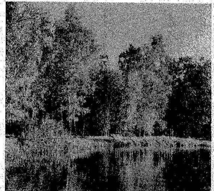
«ПЫШНОЕ ПРИРОДЫ УВЯДАНИЕ...»