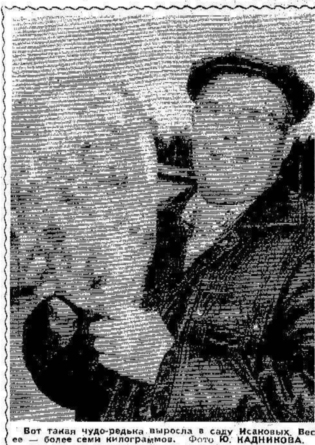
Вот такая чудо-редка выросла в саду Исановых. Веще — более семи килограммов.