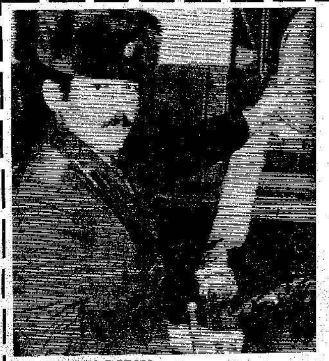
О ТЕХ, КТО РЯДОМ. Пришел в пожарную часть № 50 после службы в Армии воином-погрантином