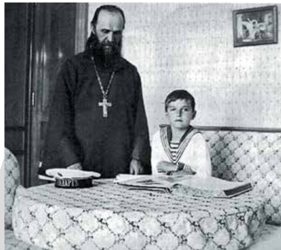
Петергоф. 1912 г.

6 августа царская семья на пароходе «Русь» прибыла в Тобольск, а 13 августа переселилась в дом губернатора. Но прийти на богослужение в церковь им разрешили только 8 сентября (на праздник Рождества Богородицы). 13 августа государь пишет в дневнике: «В 12 час <ов> был отслужен молебен, и священник окропил все комнаты Св<ятой> водой». Певчими были