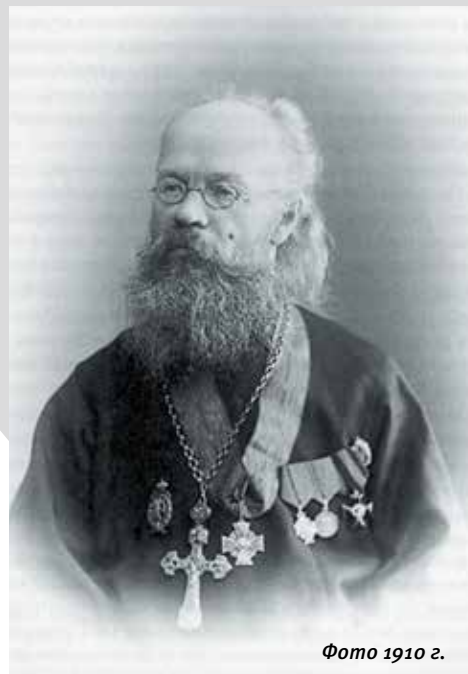
Фото 1910 г.