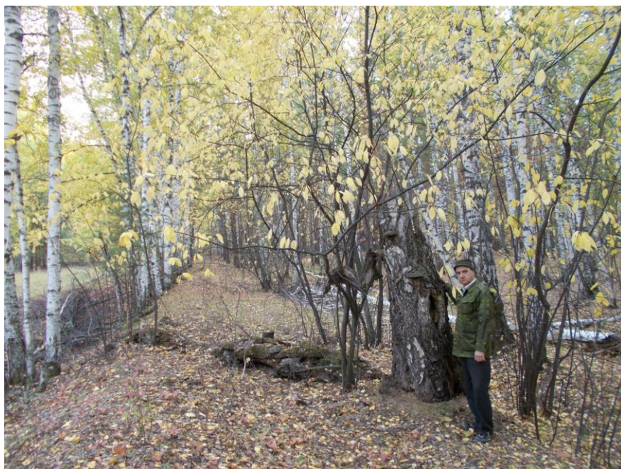
К статье Копырина А.Л. «Старый Сибирский тракт». Остатки старой трассы.