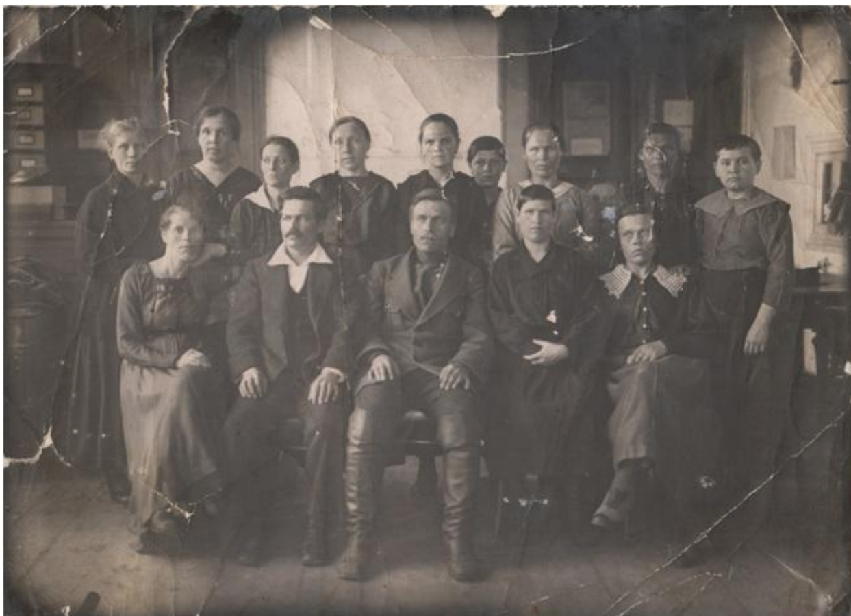
К статье Атанасовой И.Ю. «Библиотекам Асбеста – 100 лет» ( О книге «Моя библиотека»). Первые читатели.