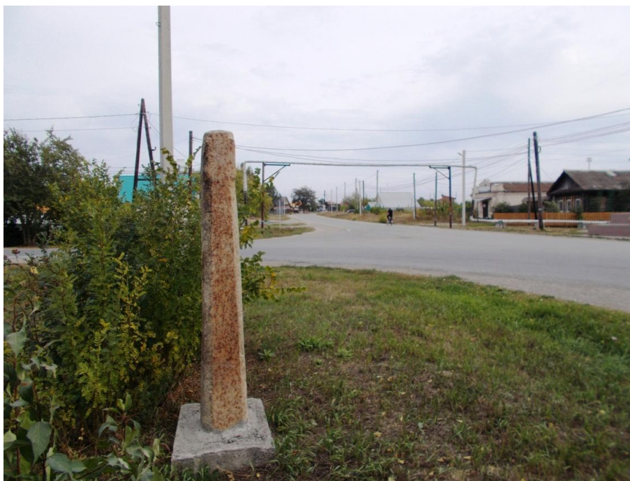
К статье Копырина А.Л. «Старый Сибирский тракт». Верстовой столб в с. Грязновском