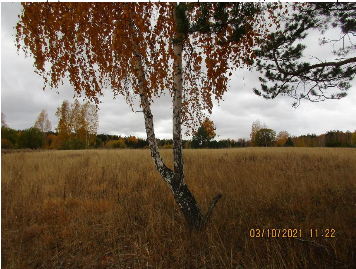
К статье Сухарева Ю.М. «Угольная Черемшанка». Площадка бывшего поселка Черемшанка. Фото 2021 г