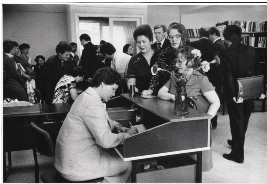
К статье Атанасовой И.Ю. «Библиотекам Асбеста – 100 лет» ( О книге «Моя библиотека»). В очередь...