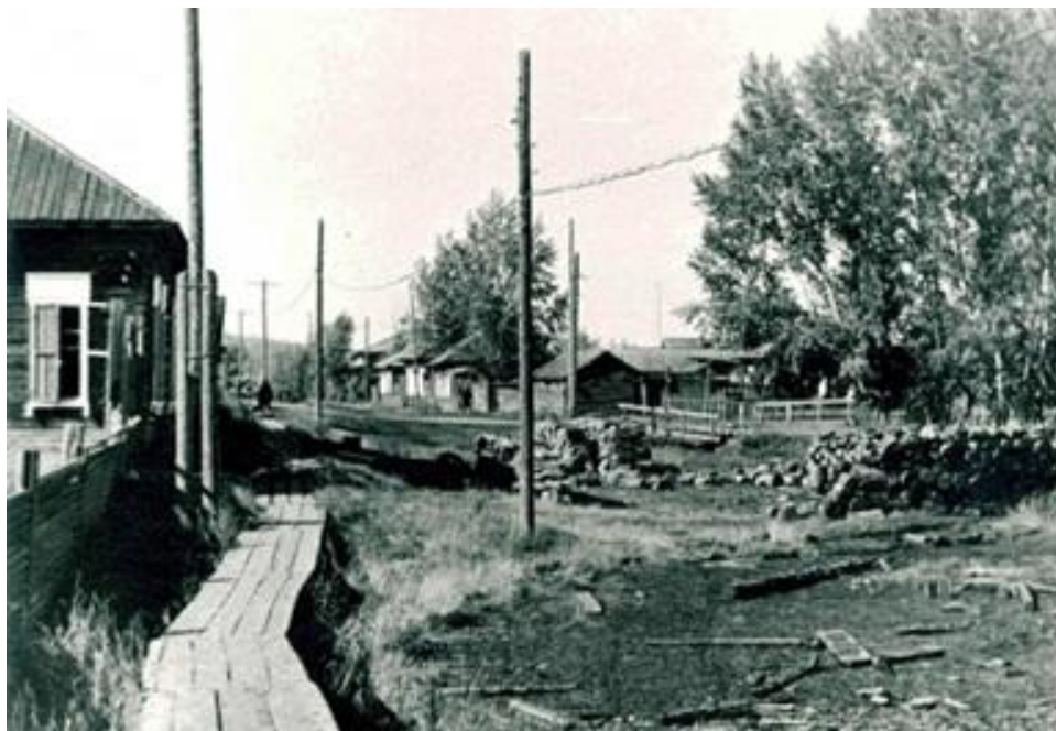
Бессонова А. Посёлки на территории города Асбеста Поселок Щебеночный