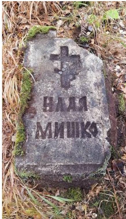
Рубцов В.Н. Забытый погост