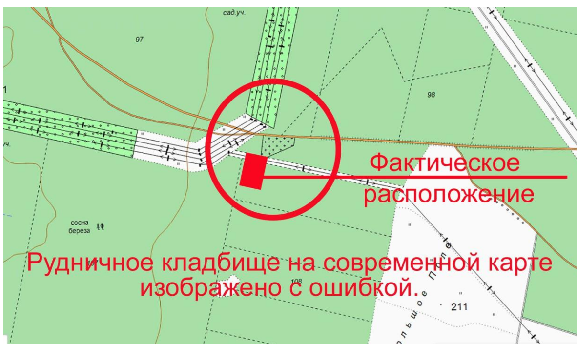
Рубцов В.Н. Забытый погост