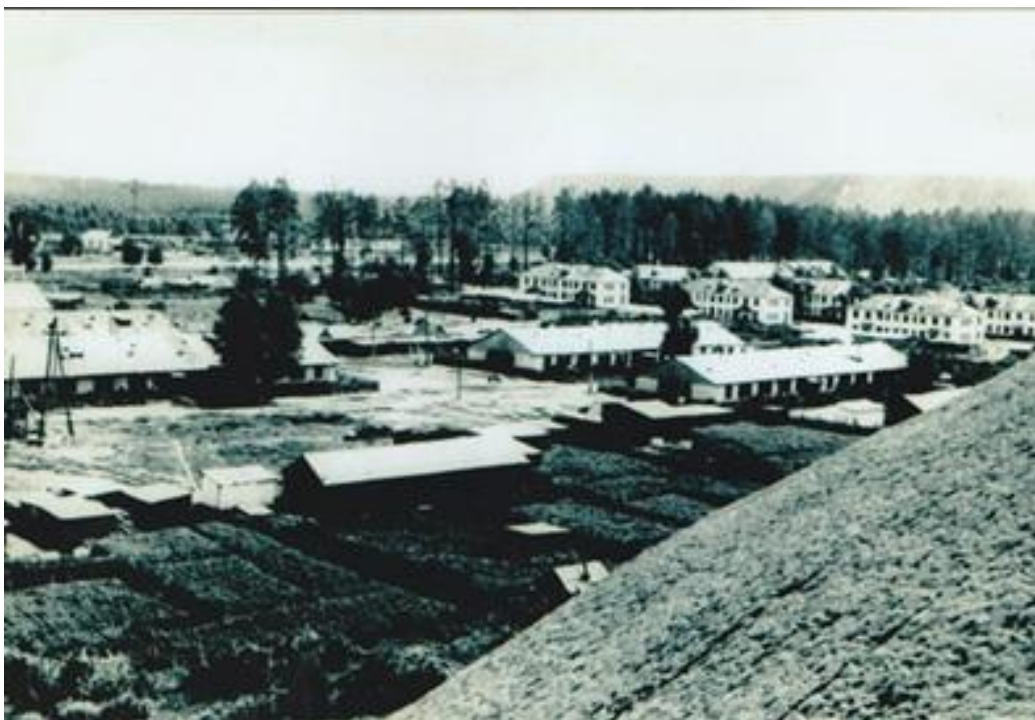
Бессонова А. Посёлки на территории города Асбеста Поселок Талицкий