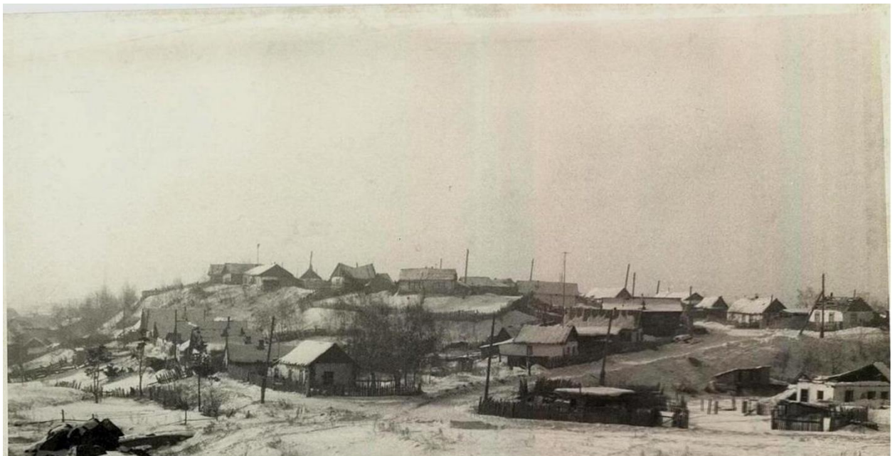
Поселок Горный. Николаевский отвал. 1949 г.