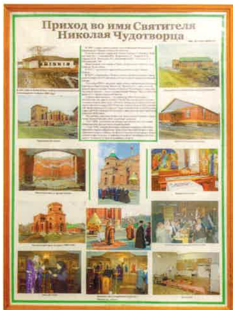
Приход во имя Николая Чудотворца