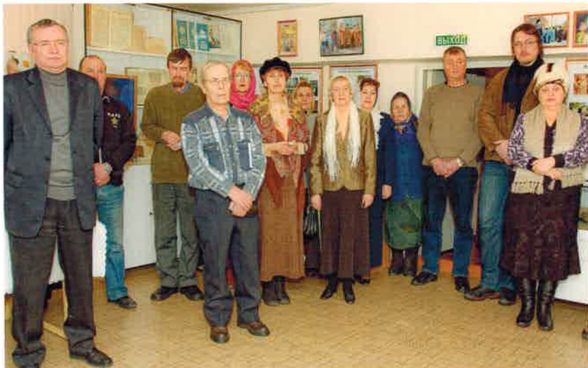
Участники торжества в день открытия музея 13.02.2010

«Сегодня прихожане носят кирпич с улицы, щебёнку под алтарь. Женщины, словно в колхозе – основная рабочая сила, но все они – добровольцы. Видимо, сам Бог даёт им силы...»