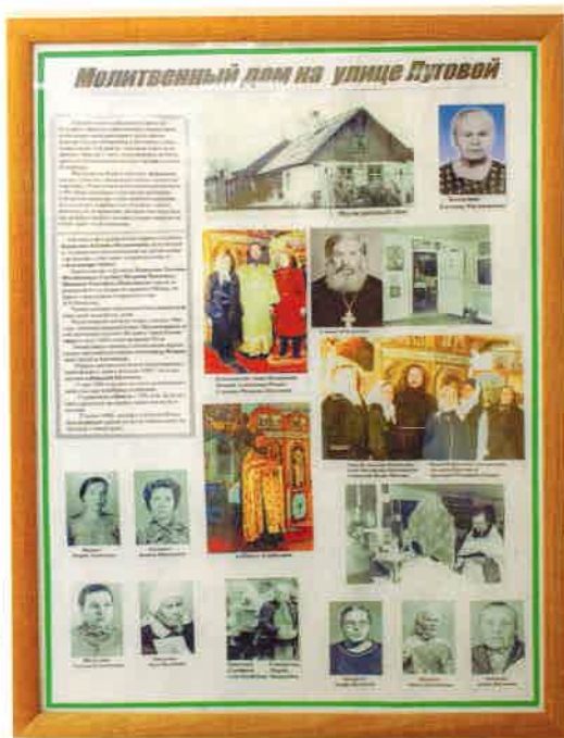
Молитвенный дом на Луговой

Объяснила цель своего приезда, рассказала о сборе материалов для организации православного музея в Асбесте: воспоминаний участников строительства в г. Асбесте молитвенного дома на ул. Луговой, Князе-Владимирского храма, церкви в п. Рефтинском, а также фотографий и других экспонатов.