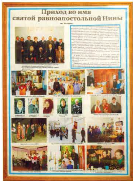
Приход во имя Равноапостольной Нины