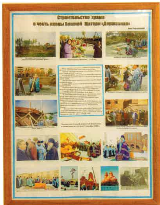
Приход иконы «Державная»